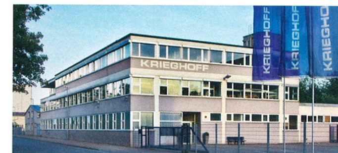
Krieghoff GmbH, Boschstrasse, Ulm am Donau, som den ser ud i dag med cirka 100 beskæftigede.