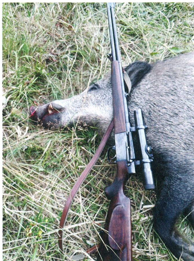
Krieghoff Semi-automatriffel fra 1930'erne er meget sjælden, men nogle få bruges til jagt den dag i dag. Denne er en top-raritet fra 1938, som fremstår helt original i kaliber 8x60S og med en Zeiss Ziel-multi 1,5-4 Vario-kikkert på Krieghoffs originale Aufschubmontage med "see-through"-tunnel.