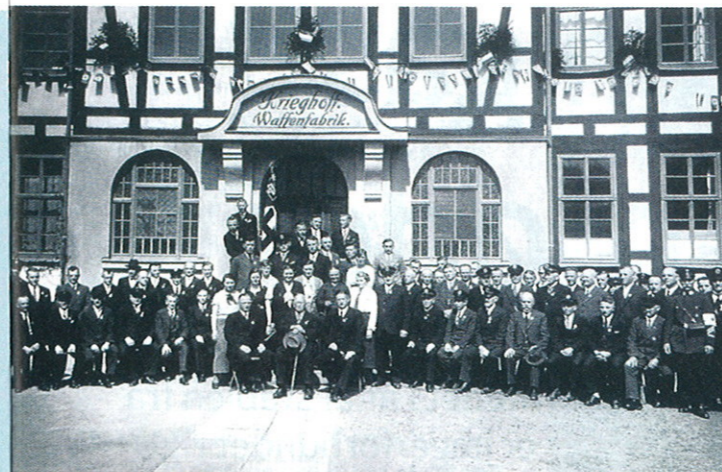
Krieghoff-fabrikens medarbejdere samlet på "Tag der Arbeit" foran fabrikken den 1. maj 1934. Bemærk de tre fra Krieghoff-familien i forgrunden.

Selvom konkurrencen fra Perazzi har været betydelig, er K-80 stadig det ultimative til trap, skeet og sporting i USA. Modeludviklingen er baseret på en førkrigs-"Remington Model 32", som en amerikaner havde med til Krieghoff i 1954 for at få lavet en lignende model til salg i USA. Krieghoffs model kom til at hedde K-32, og i 1980 blev denne opgraderet til K-80, der har endnu bedre aftræksmekanisme, letvægtsløb, gedigent design og meget fin balance. Den er kendt for stor robusthed og slidstyrke og den måske bedste aftræksmekanisme af alle. En variant kaldet K-80 Par-