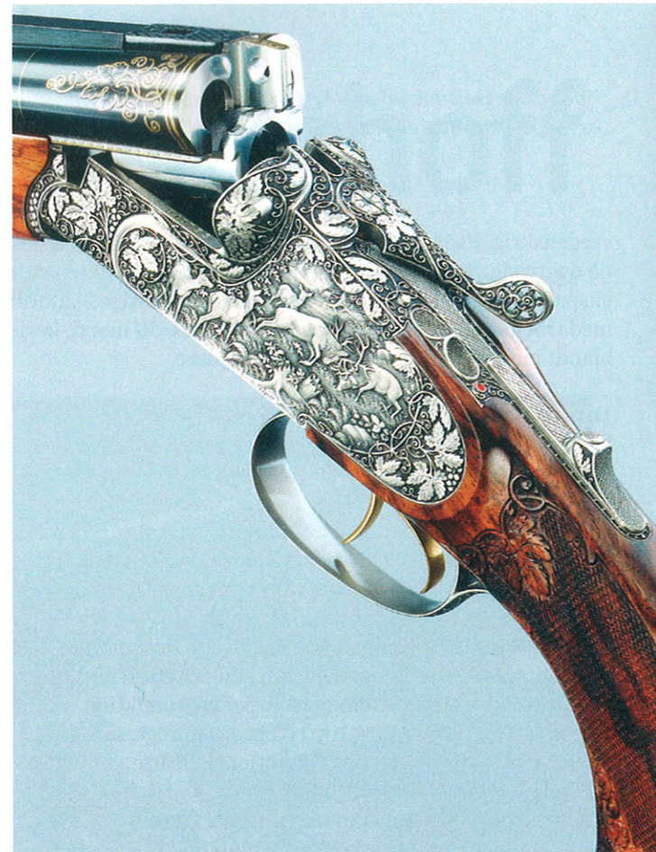
Krieghoff Doppelbüchsdreiwaffen med separat kuglespænding og sikring på kolbehalsen. Bemærk også gravurearbejdet med fint guldindlæg. Topkvalitet i enhver detalje.